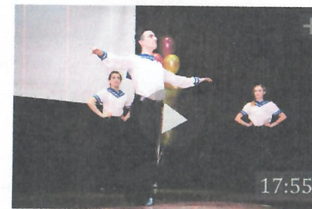
Просвещение в студенты 2016