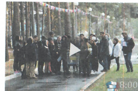
Федеральная школа самоуправления